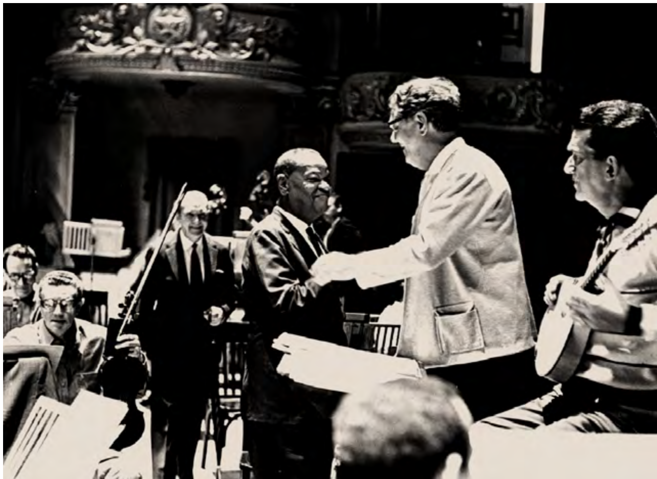
Pixinguinha, Radamés e Jacob do Bandolin, Theatro Municipal do Rio de Janeiro